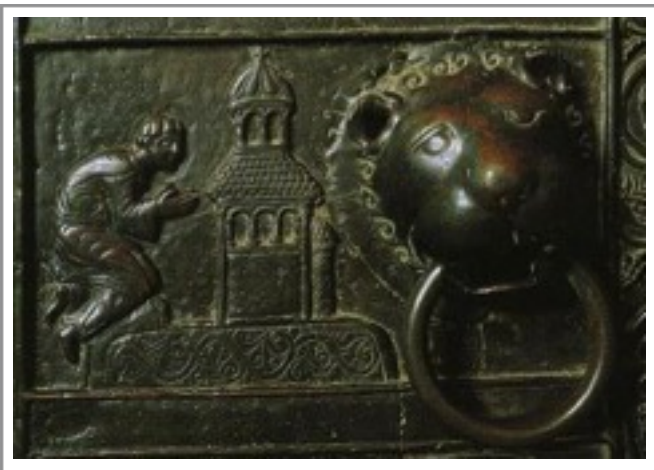
Kép: Az imádkozó Adalbert (©, p. 23)

A szentekhez illő tartalmas életet ismerhetett meg a szerzetesek hétköznapijainak során. Amikor a szerzetesek azzal a kéréssel ostromolták, hogy térjen vissza püspöki székébe, és lásson el olyan hivatali feladatokat, mint pl. a templomok felszentelése, Adalbert hevesen tiltakozott. Tudatosan vállalta fel az egyszerű szerzetesi életvitelt Aven-tinóban. Kevesebbet szolgált, helyette sok időt fordított imára, meditációra és elmélkedésre.