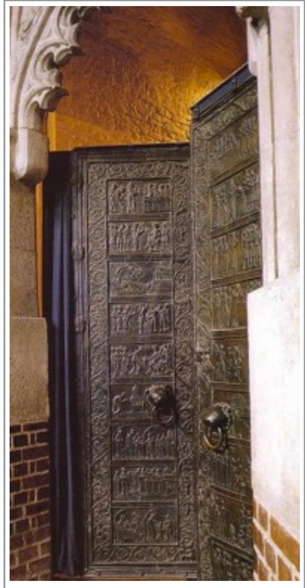
Kép: A gnieznoi Mária-katedrális ajtaja, amely Prágai Adalbert életének állomásait ábrázolja (©, 81.o.)

fonódás és egység alapjaira. Ő az európai identitás egyik alapító alakja. Gnieznoban vagy Prágában, de Aachenben és Rómában is ápolni kellene Adalbert európai szentként tisztelt emlékét, amely Adalbert teljes életét és ténykedésének hatását helyezi előtérbe.