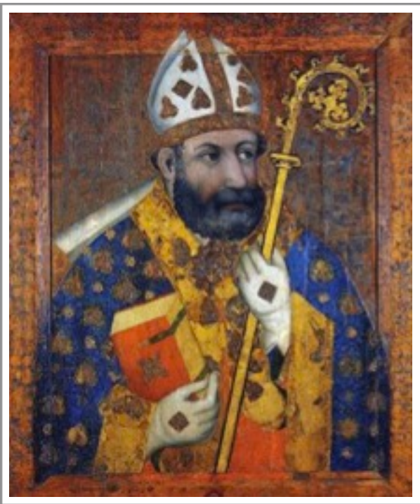
Kép: Adalbert ábrázolása a Prága melletti Karlstejn várában (©, elülső borítókép)