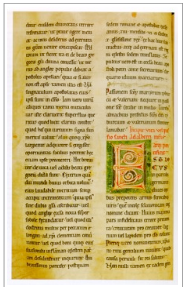
Kép: A fellelt aacheni kézirat Adalbert életről: Az „E” iniciálé Adalbert életrajzána kézirataiban, 1200 körül

Az Adalbert Alapítvány a történelmi összefüggések átfogó ismeretében kezeli szent Adalbert tiszteletének politikai jellegű munkáit. Az Adalbert halálának ezredik évfordulója alkalmából szorgalmazott kutatások fontos