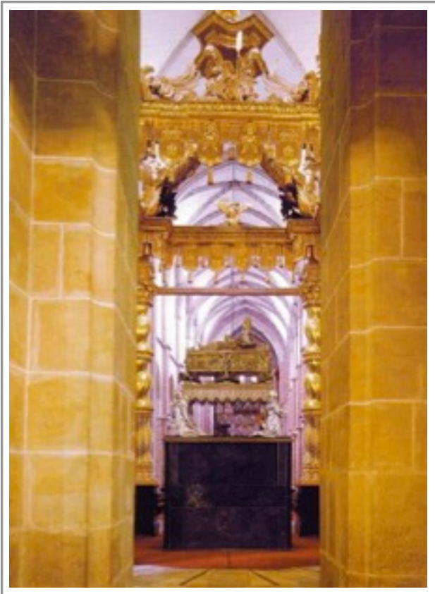
Kép: A gineznoi Mária-templomban található sír

Felvezették a kivégző dombra – 997. április 23-án -, ahol a pogány pap egy dárdával átszúrta testét. A legenda szerint Adalbert a saját és gyilkosai lelki üdvéért fohászolt, míg kilhelte lelkét. A gyilkosok Adalberten töltötték ki haragjukat. Lefejezték, fejét pedig cölöpre verték. A hagyomány más-más helyszínt nevez meg a vértanúhalál helyének. A legvalószínűbbnek tartott helyszín a Nagat és Visztula folyók között található Heiligenwalde bei Elbing. Miután a lengyel herceg értesült a mártírhalálról, s Adalbert fejét átadták, Boleszláv kiváltotta a testet és a gineznoi Mária-templomban temettette el.