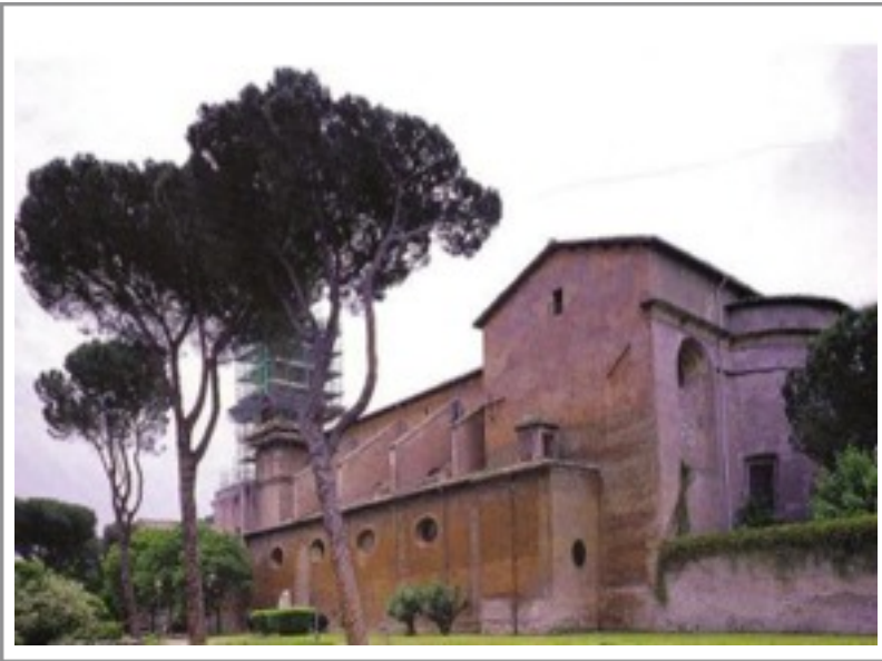
Kép: A római aventinói Szent Elek- és Bonifác-kolostor

A szentekhez illő tartalmas életet ismerhetett meg a szerzetesek hétköznapijainak során. Amikor a szerzetesek azzal a kéréssel ostromolták, hogy térjen vissza püspöki székébe, és lásson el olyan hivatali feladatokat, mint pl. a templomok felszentelése, Adalbert hevesen tiltakozott. Tudatosan vállalta fel az egyszerű szerzetesi életvitelt Aven-tinóban. Kevesebbet szolgált, helyette sok időt fordított imára, meditációra és elmélkedésre.