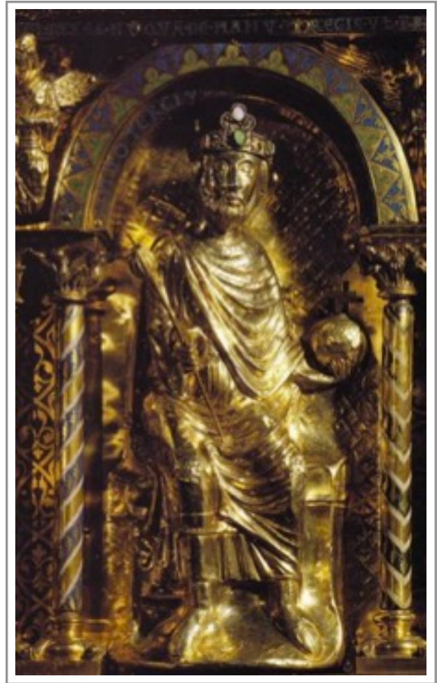
Kép: II. Ottó – Adalbert barátja (©,70. o.)

II.Szilveszter pápa, aki Adalbertet pápai felszentelése előtt ismerte meg még Rómában, már 999-ben a szentek sorába iktatta Adalbertet.