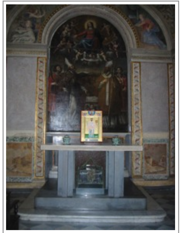
Kép: Adalbert-ereklyék a Szent Bertalan-templom oltára alatt (©, 84. o.)

Az ereklyetartóban olyan ereklyék lelhetők fel, amelyeket III. Ottó császár kapott Chrobry Boleszláv lengyel fejedelemtől 1000-ben tett gnieznoi látogatásakor. Róma tehát Adalbert tiszteletének központja, ahogy Adalbert számára is meghatározó volt élete során a város. Róma