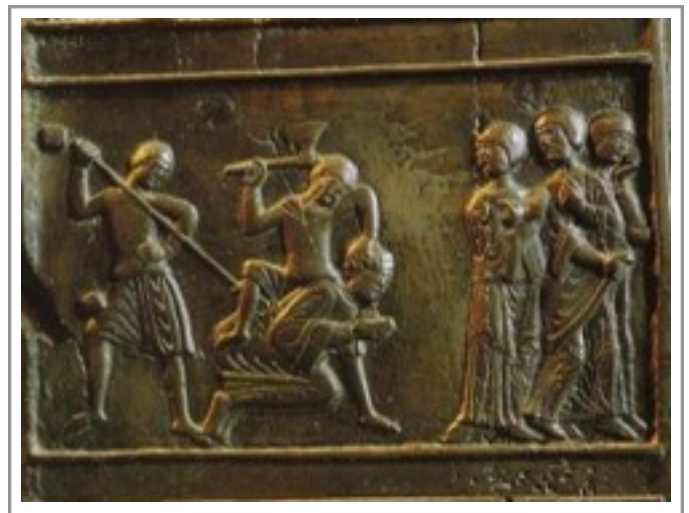
Kép: Adalbert vértanúhalála