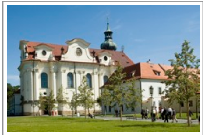
Kép: A prágai brewnovi bencés apátság ma

Akarata ellenére, a pápa iránti engedelmességben ő is Adalbert 992-ben visszatért Prágába. Püspökségét eleinte a javulás ígéretével örömmel fogadta a prágai nép. A herceg és a római Elek-kolostorból magával hozott 12 szerzetes segítségével Adalbert megalapította a brewnovi bencés apátságot.