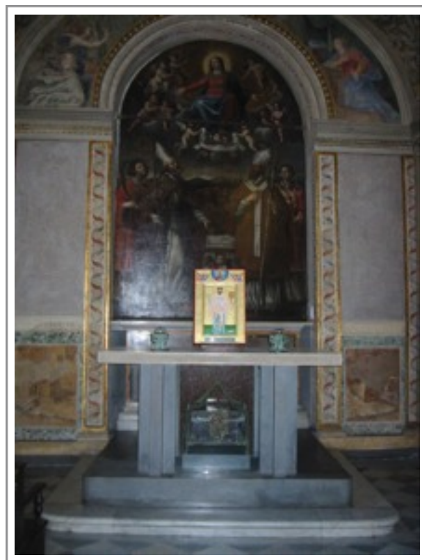
Obraz: Relikvie sv. Vojtecha pod oltárom kostola sv. Bartolomeja (©, p. 84)

V tomto relikviári sú uložené relikvie, ktoré dostal Otto III. od poľského kniežaťa Boleslava Chrabrého pri svojej návšteve v Hnezdne v roku 1000. Rím je teda centrálnym miestom pamiatky sv. Vojtecha, rovnako ako bol centrálnym miestom jeho života.