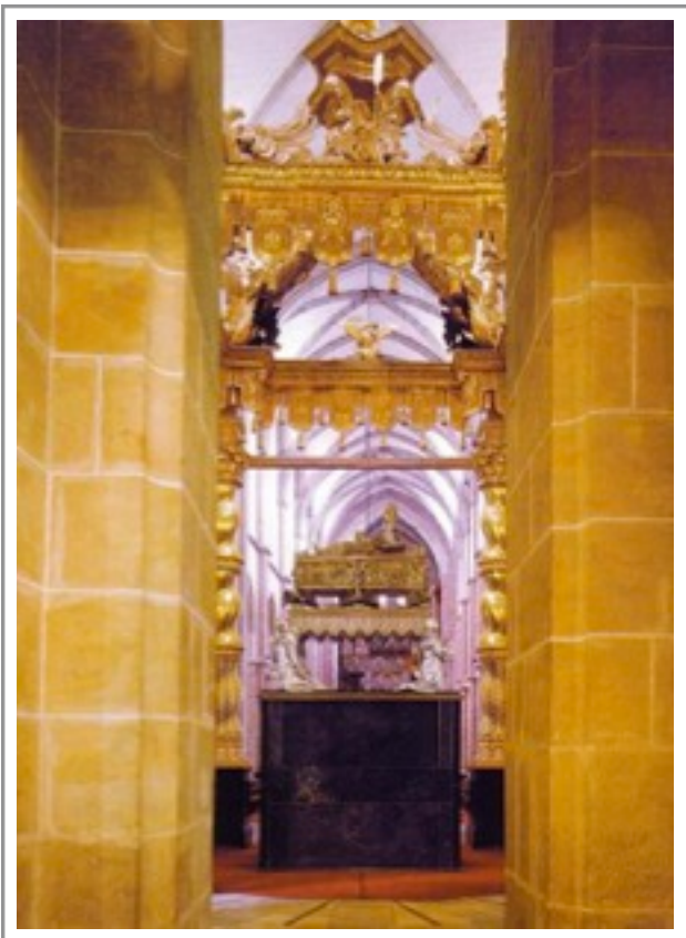
Obraz: Náhrobok v kostole Panny Márie v Hnezdne dnes (©, p. 87)

Bol 23. apríl 997, keď Vojtecha vyviedli na súdny pahorok, kde ho pohanský kňaz prebodol kopijou. Legenda hovorí, že umierajúci Vojtech prosil za spásu svojej duše i duše svojho vraha. Vrahovia sa vyzúrili aj na mŕtvom Vojtehovom tele. Odsekli mu hlavu a napichli ju na kôl. Tradícia označuje viacero miest za dejisko mučeníckej smrti. S najväčšou pravdepodobnosťou išlo o Heiligenwald pri Elbingu, v kraji medzi riekami Nogat a Visla. Keď sa poľské knieža Boleslav dozvedel o mučeníckej smrti, a keď dostal aj Vojtechovu hlavu, rozhodol sa zaplatiť Prusom výkupné za ostatok mŕtveho tela a dal ho pochovať v kostole Panny Márie v Hnezdne.