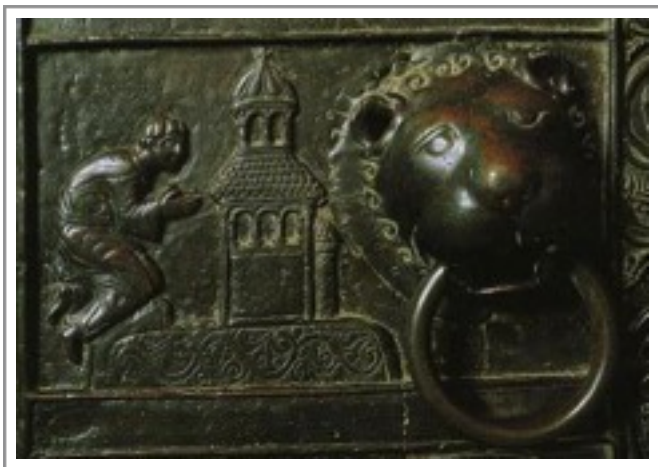
Obraz: Modliaci sa Vojtech (, p. 23)

Vojtech sa zúčastňoval každodenného mníškeho života a dosiahol vysoký stupeň svätosti. Dôrazne protestoval, keď ho mnísi chceli naďalej využívať ako úradujúceho biskupa napríklad pri posväcovaní kostolov. Vojtech žil na Aventíne náročky skromným životom mnícha, vykonával nízke služby a trávil veľa času pri modlitbe, meditácii a kontemplácii.