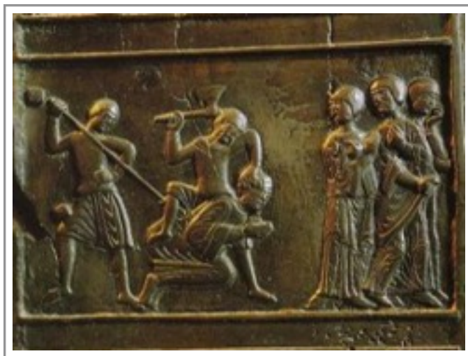
Obraz: Vojtechova mučenícka smrť