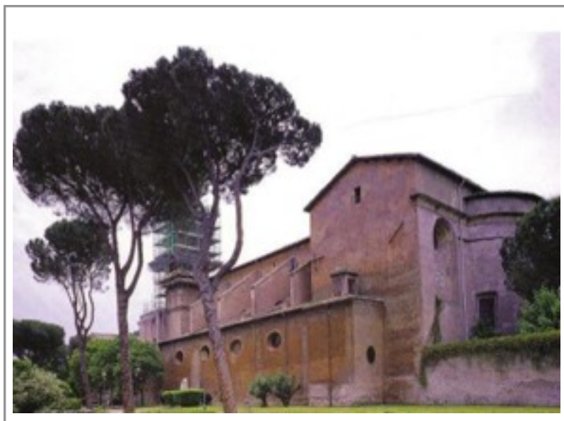
Obraz: Benediktínsky kláštor sv. Bonifáca a sv. Alexia na Aventíne v Ríme

Vojtech sa zúčastňoval každodenného mníškeho života a dosiahol vysoký stupeň svätosti. Dôrazne protestoval, keď ho mnísi chceli naďalej využívať ako úradujúceho biskupa napríklad pri posväcovaní kostolov. Vojtech žil na Aventíne náročky skromným životom mnícha, vykonával nízke služby a trávil veľa času pri modlitbe, meditácii a kontemplácii.