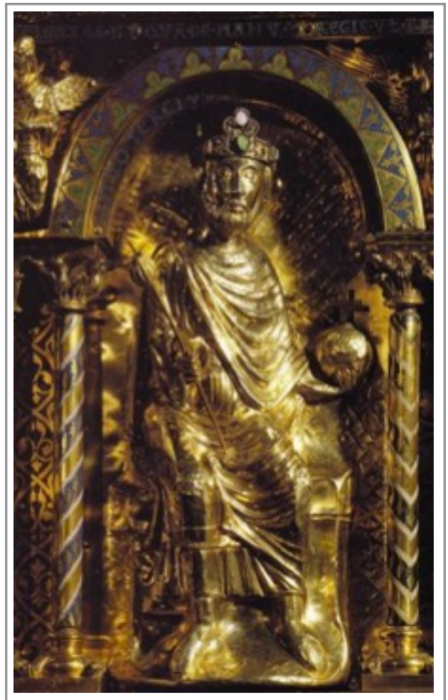
Obraz: Otto III. – Vojtechov priateľ' (©, p. 70)

Vojtechova smrť vyvolala obrovskú odozvu v západnom kresťanstve. Pápež Silvester II., ktorý sa s Vojtechom zoznámil v Ríme pred svojím zvolením, vyhlásil Vojtecha už v roku 999 za svätého.