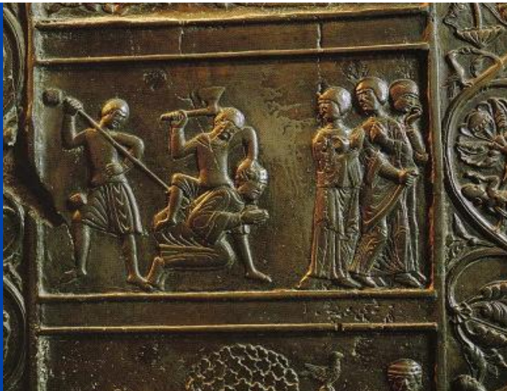
Vojtechova mučenícka smrť