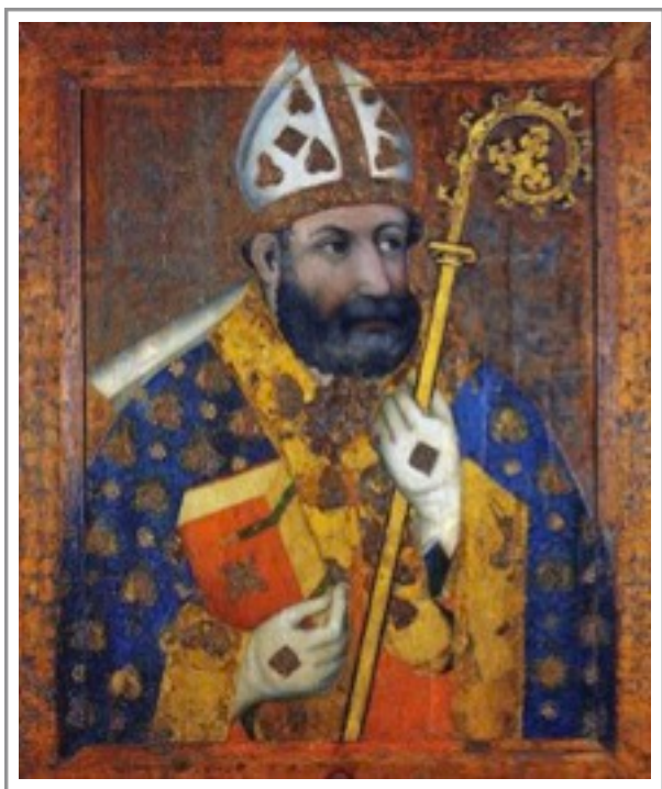
Obraz: Zobrazenie sv. Vojtecha v Karlsteine pri Prahe

Aj z politického hľadiska zastupuje Vojtech skôr univerzálne, než partikulárne. Mohli by sme ho označiť za „politického“ svätca, keďže sa v istom období dostal do víru politiky. Aj v dejinách uctievania sv. Vojtecha došlo k istej inštrumentalizácii tejto úcty. Ukázalo sa to práve pri výtvarnom zobrazení, ktoré nechal vyhotoviť Karol VI. Ide o tabuľový obraz z dielne majstra Teodoricha v kaplnke Svätého kríža v impozantnom Karlsteinskom zámku v srdci Čiech. 15