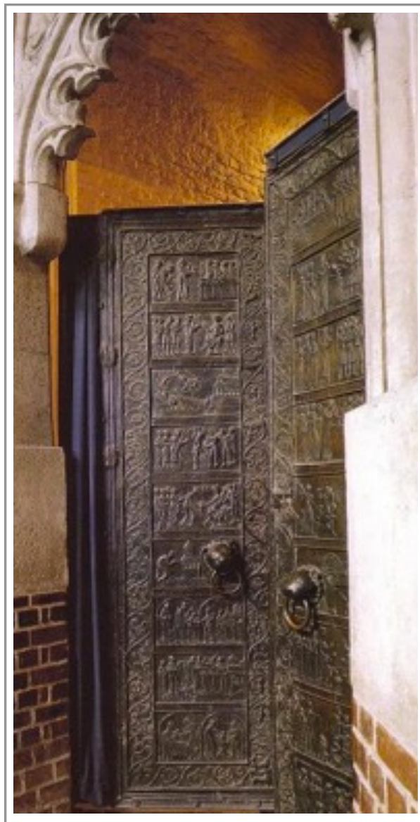
Obraz: Hnezdno – brána mariánskej katedrály s jednotlivými etapami života sv. Vojtecha.

pestovať vzťah k Vojtechovi ako európskemu svätcovi, vzťah, ktorý obsiahne celý jeho život a pôsobenie.