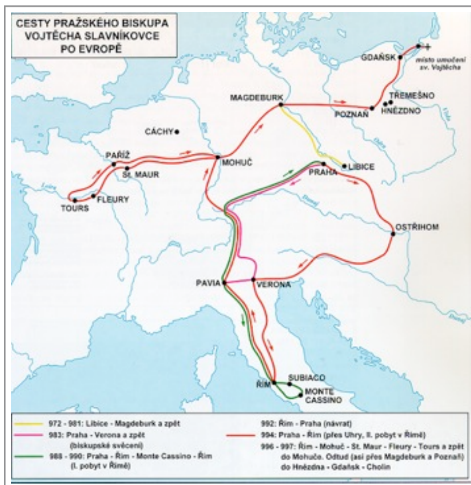
Obrázok: Vojtechove cesty (©, p. 98)

Počas rokov strávených v Magdeburgu prijal Vojtech sviatosť birmovania od magdeburgského arcibiskupa Adalberta.