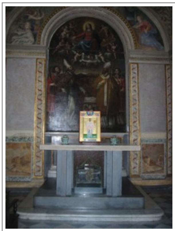
Fotografie: Vojtěchovy relikvie pod oltářem v kostele sv. Bartoloměje

V něm jsou uchovány relikvie, které Otto III. obdržel od polského knížete Boleslava Chrabrého při své návštěvě Hnězda v roce 1000. Řím představuje ústřední místo svatovojtěšského kultu a byl ostatně důležitý i pro Vojtěchův život: