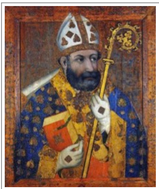
Fotografie: Vojtěchův obraz na hradě Karlštejn

I z politického hlediska symbolizuje Vojtěch spíše univerzální než dílčí zájmy. Mohli bychom ho nazvat „politickým“ světcem, jelikož se v průběhu svého života dostal do víru politiky. Jeho kult v průběhu dějin zažil jakousi politickou instrumentalizaci. Očividné je to na deskovém obraze Mistra Theodorika, který nechal Karel IV. zhotovit pro kapli svatého Kříže na impozantním hradě Karlštejn v srdci Čech. 15