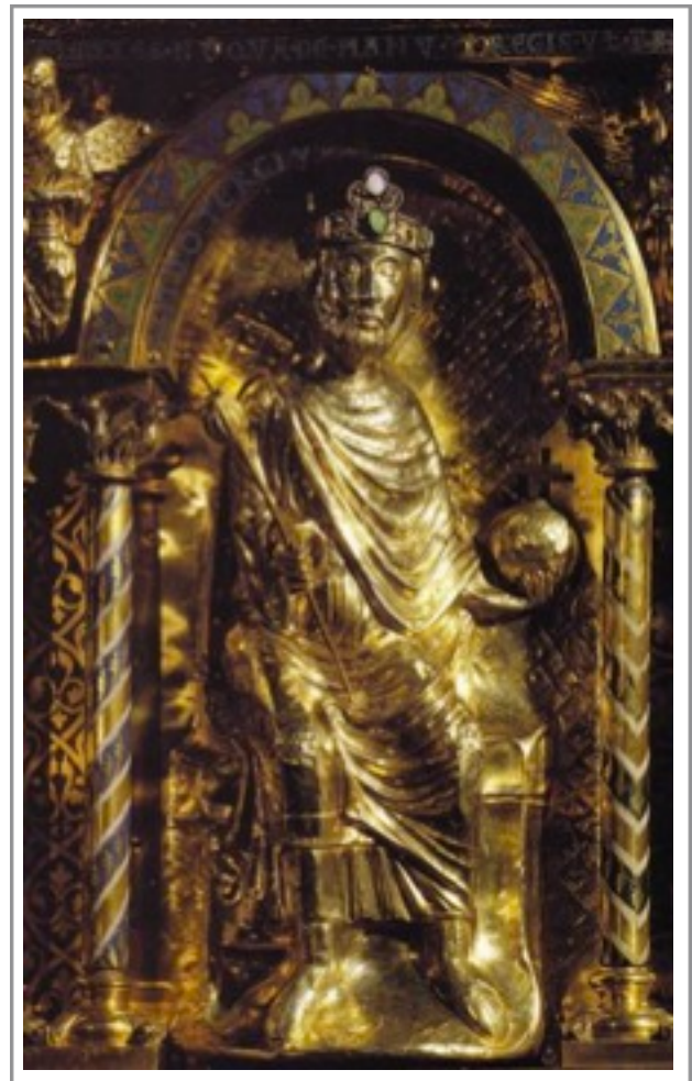
Fotografie: Otto II. – Vojtěchův přítel (©, str. 70).

V západním křesťanství vzbudila Vojtěchova smrt velký ohlas. Papež Silvestr II., který Vojtěcha poznal v Římě před svým zvolením papežem, ho v roce 999 svatořečil.