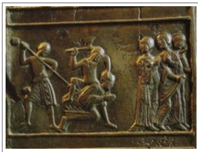
Fotografie: Vojtěchova mučednická smrt (©, str. 74)

Prahy. Vojtěch se snažil získat od Řehoře V. souhlas s tím, že bude hlásat evangelium pohanům, jelikož návrat do Prahy už nepovažoval za možný. Když mu papež svolení udělil, vydal se na misijní cestu. Ta ho nejprve vedla přes Francii do Německa. V Mohuči se opět setkal s Ottou III. Nakonec dorazil do Polska. V Hnězdně mu polský kníže Boleslav Chrabrý svěčil misii mezi Prusy. Když Vojtěch po krátké plavbě z Hnězdna narazil společně se svým bratrem Radimem, který přijal řádové jméno Gaudencius, a v doprovodu jednoho sluhy na Prusy, sázel na účinek zvěstovaného evangelia. Došlo k velmi konfliktnímu setkání, při kterém byli misionáři důrazně vyzváni, aby zemi opustili. Přestože se Vojtěch se svými druhy stáhl, Prusové ho druhého dne přepadli a přemohli.