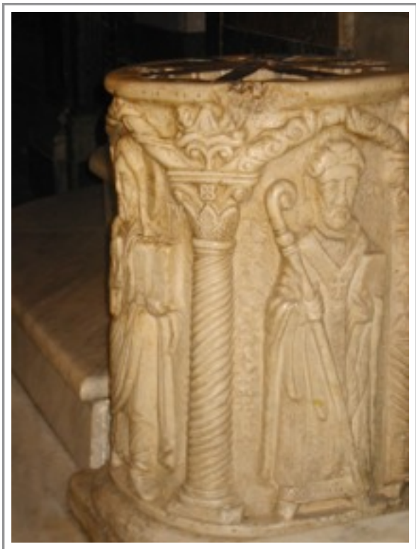
Fotografie: Nejstarší zobrazení svatého Vojtěcha na křtitelnici v kostele sv. Bartoloměje na Tiberském ostrově v Římě (©, str. 83)

V kostele sv. Bartoloměje na Tiberském ostrově totiž najdeme nejstarší vyobrazení Vojtěchovy postavy: kamenný reliéf na lemu tamější křtitelnice.