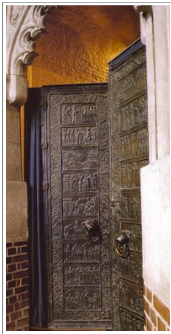
Fotografie: Brána katedrály Panny Marie v Hnězdně se situací z Vojtěchova života (©, str. 81)

Jan Pavel II. navštívil dne 3. června 1997 Vojtěchův hrob v Hnězdně. Na eucharistii tam pozval prezidenta Polska, České republiky, Litvy, Německa, Slovenska, Ukrajiny a Maďarska, aby vyjádřil evropskou dimenzi svatovo- jtěšské tradice. Papež věděl o zvláštích tradicích národů střední a východní Evropy, které s Vojtěchovou postavou souvisí. Připomněl je, uctil je a zároveň je zasadil do ev- ropského kontextu, do kterého život a působení svatého Vojtěcha patří. Ten, kdo se podívá na Vojtěchův životopis a jednotlivá zastavení jeho života a uvědomí si nez- vyklé a stále aktuální dějiny uctívání tohoto světce, ne- bude moci evropský charakter svatého Vojtěcha popřít. Jeho životní zastavení tvoří dohromady mapu Evropy. Jeho vliv spojuje středoevropské národy a odkazuje na základy evropské sounáležitosti a jednoty. Patří k zak- ladatelům evropské identity. Právě v Hnězdně, ale i v Praze, Cáchách nebo Římě by měl být pěstován takový vztah k Vojtěchovi coby evropskému světci, který se zaměří na jeho život a působení jako celek.