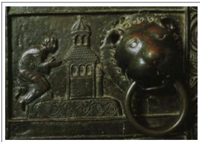
Fotografie na str. 6: Modlíci se Vojtěch (©, str. 23)

Vojtěch se účastnil běžného dění v klášteře, a to na vysoké úrovni svátostného života. Důrazně protestoval, když mu mniši i nadále přisuzovali úřad biskupa, například při svěcení kostelů. Na Aventinu Vojtěch vědomě žil prostým mnišským životem. Vykonával podřadné práce a trávil mnoho času v modlitbě, meditaci a kontemplaci.