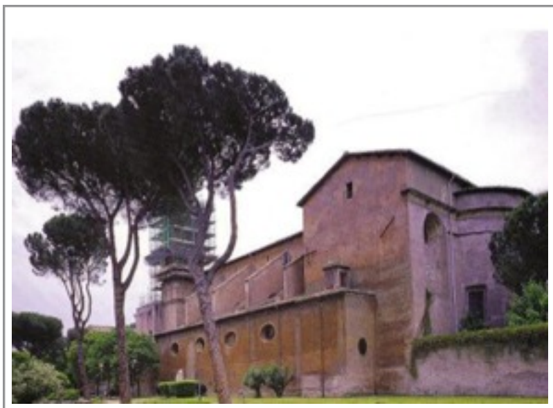
Fotografie: Benediktinský klášter sv. Bonifáce a Alexia na Aventinu v Římě (©, str. 36)

Vojtěch se účastnil běžného dění v klášteře, a to na vysoké úrovni svátostného života. Důrazně protestoval, když mu mniši i nadále přisuzovali úřad biskupa, například při svěcení kostelů. Na Aventinu Vojtěch vědomě žil prostým mnišským životem. Vykonával podřadné práce a trávil mnoho času v modlitbě, meditaci a kontemplaci.