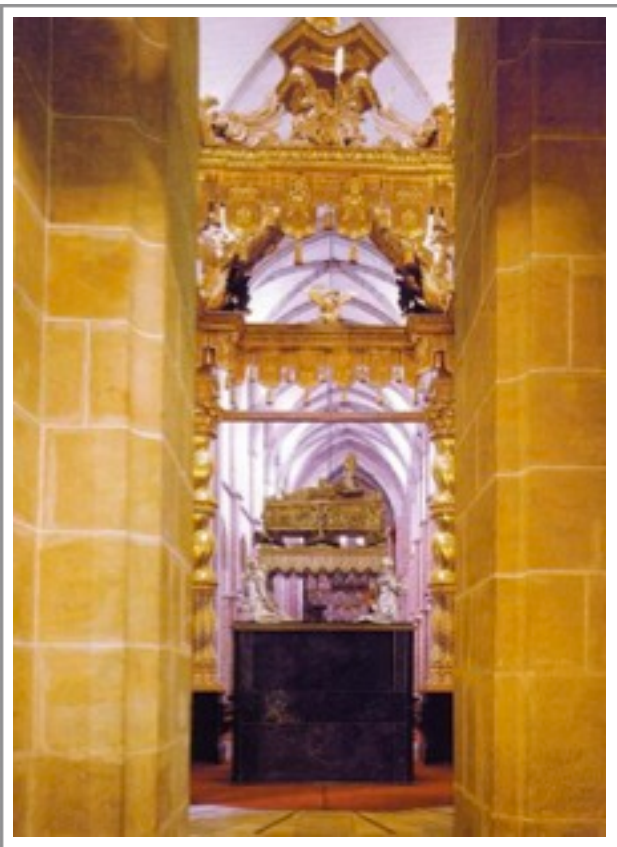
Fotografie: Hrob v chrámu Panny Marie v Hnězdně

23. dubna 997 byl vyveden na soudní vrch a zde ho pohanský kněz probodl oštěpem. Podle legendy umírající Vojtěch úpěnlivě prosil o spásu duše své i svého vraha. Vrazi si na mrtvém Vojtěchově těle vybili svou zlost. Usekli mu hlavu a nabodli ji na kůl. Tradice jako místo mučení uvádí různá místa. Nejpravděpodobnější variantou je Heiligenwalde u Elbingu, v oblasti mezi řekami Nogatem a Vislou. Když se polský kníže Boleslav dozvěděl o mučednickově smrti a obdržel jeho hlavu, vykoupil od Prusů zbytek jeho těla a nechal ho pohřbit v katedrále Panny Marie v Hnězdně.