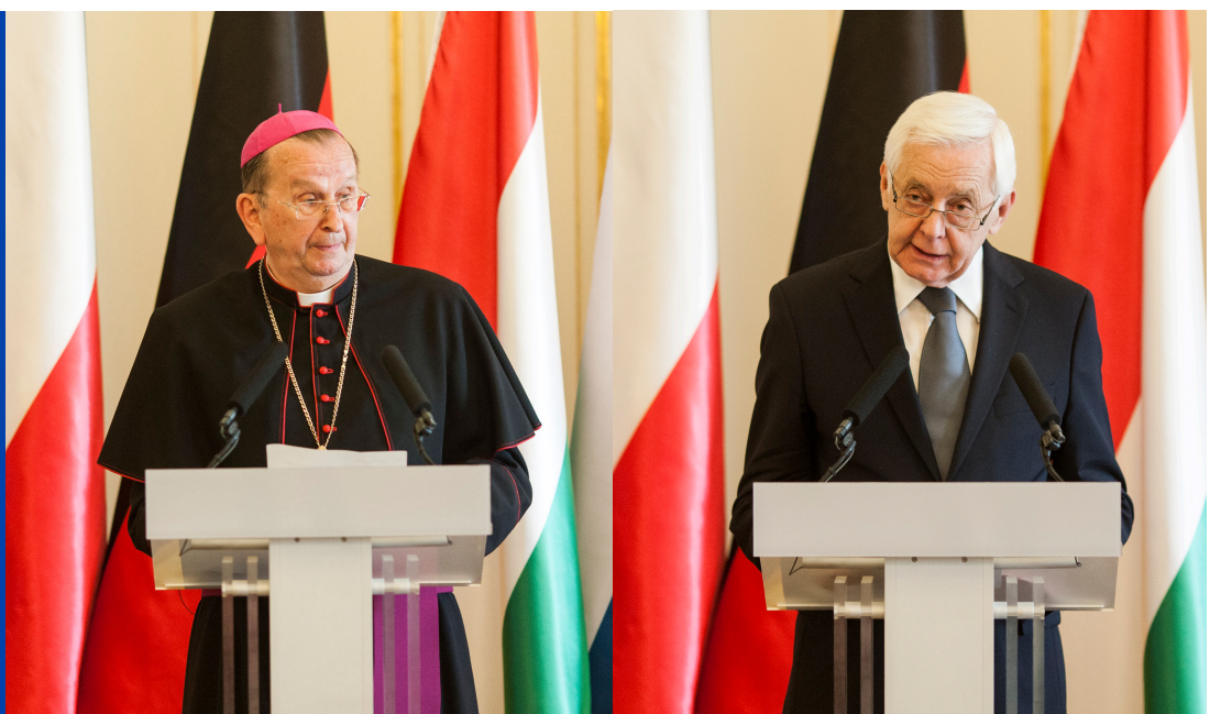
Minister a. D. Dr. Rudolf Chmel