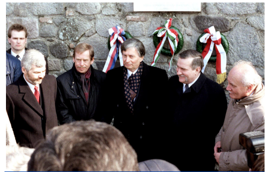
Erster Viségrad Gipfel im Jahr 1991. V.l.n.r.: Krzysztof Bielecki, Václav Havel, József Antall, Lech Walesa, Árpád Göncz