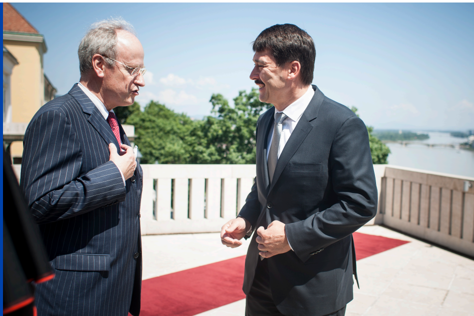
Staatspräsident Dr. János Áder