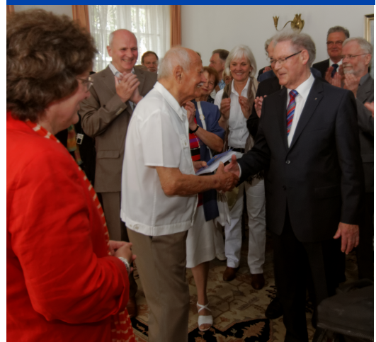
Präsident a. D. Á. Göncz, Prof. Dr. H. Süßmuth

Zum Abschluss der Visite in Budapest legten die Vertreter der Adalbert-Stiftung bei einer Rundfahrt zu den Stätten der Geschichte und des Gedenkens Kränze am Heldenplatz zu Ehren des Unbekannten Soldaten, an der Großen Synagoge und am Grabmal des früheren ungarischen Ministerpräsidenten und Adalbert-Preisträger József Antall nieder.